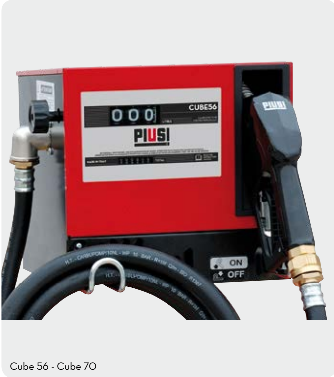
Cube 56 - Cube 70