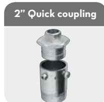
2" Quick coupling