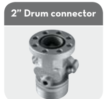
2" Drum connector