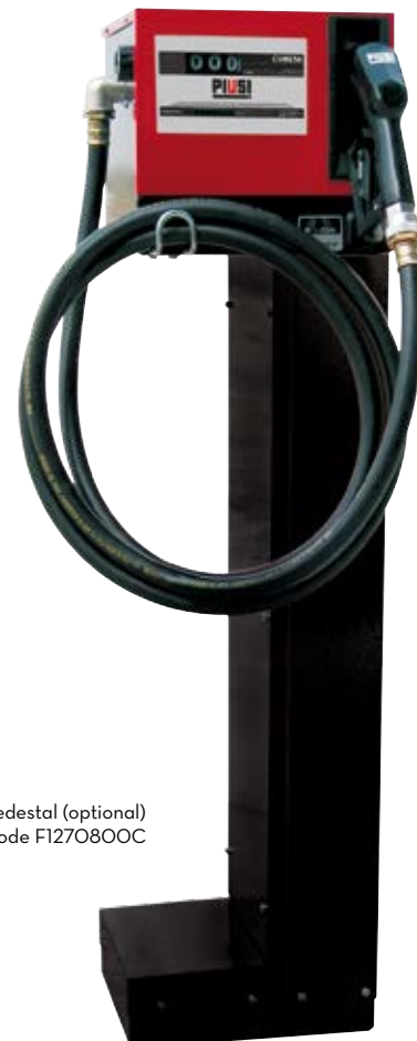
Pedestal (optional) Code F1270800C